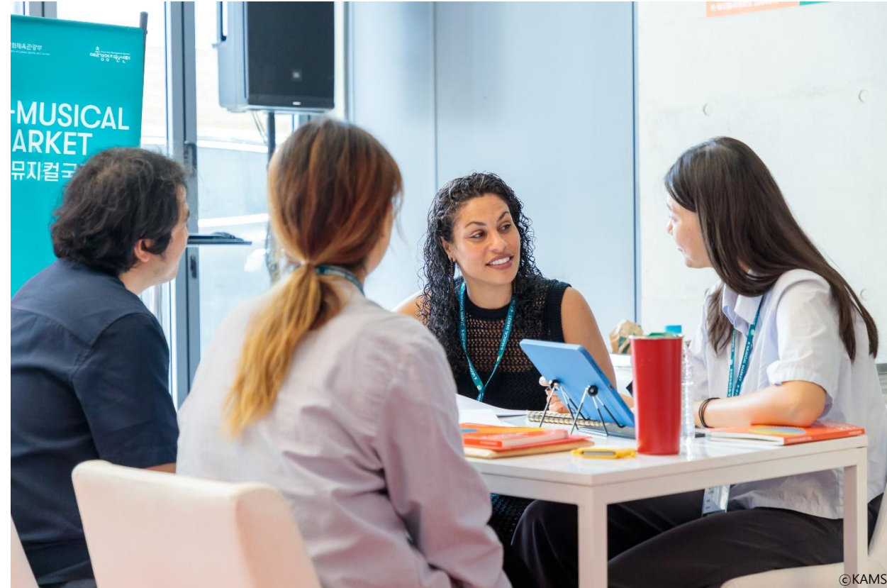
▶ 2024 K-뮤지컬국제마켓 1대1 비즈니스미팅