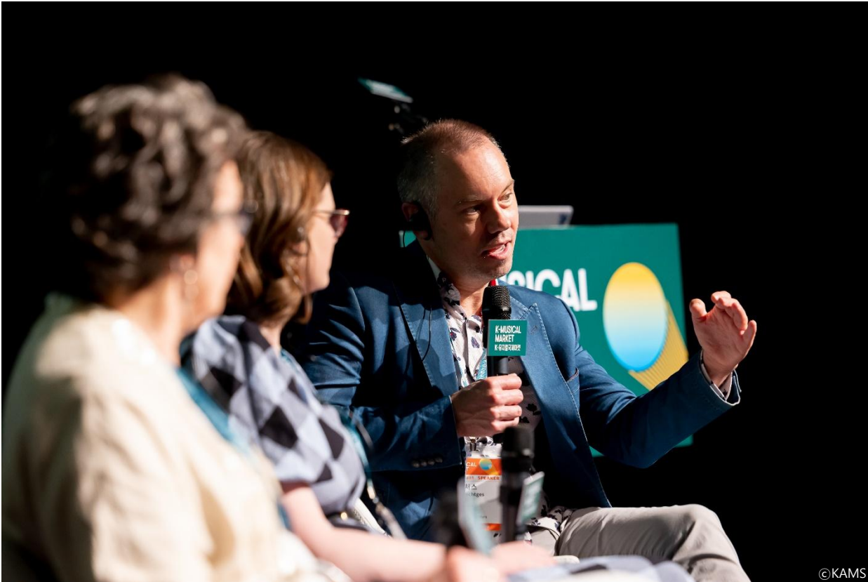
▶ 2024 K-뮤지컬국제마켓 영미 제작극장의 신작개발 콘퍼런스